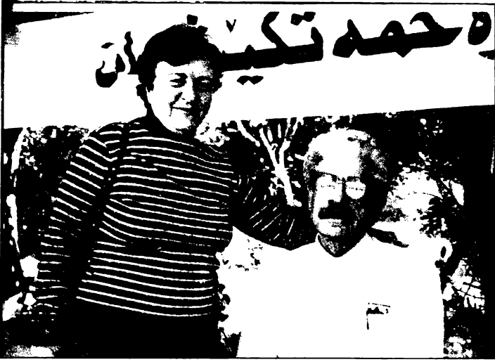
في المؤتمر الخامس للحزب الشيوعي العراقي المنعقد في ١٠/١٢ - ١٠/٢٥/١٩٩٣ في كردستان